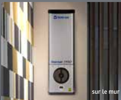
sur le mur

Avoir un environnement bactériologique sûr