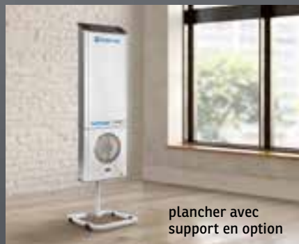
plancher avec support en option